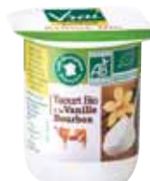
Yaourt à la vanille Bourbon 125g x 24