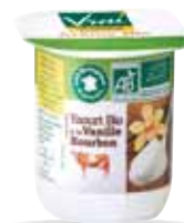
Yaourt à la vanille Bourbon 100g x 48