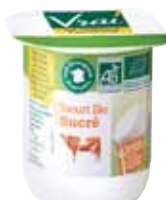
Yaourt sucré lait 1/2 écrémé 125g x 24