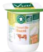
Yaourt sucré lait 1/2 écrémé 100g x 48