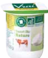
Yaourt nature lait 1/2 écrémé 125g x 24