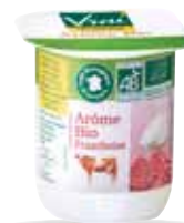
Yaourt à la framboise 100g x 48