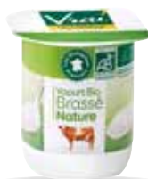
Yaourt brassé nature lait entier 100g x 48