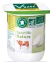
Yaourt nature lait 1/2 écrémé 100g x 48