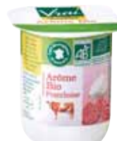
Yaourt à la framboise 125g x 24