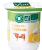
Lait fermenté bifidus citron 125g x 24